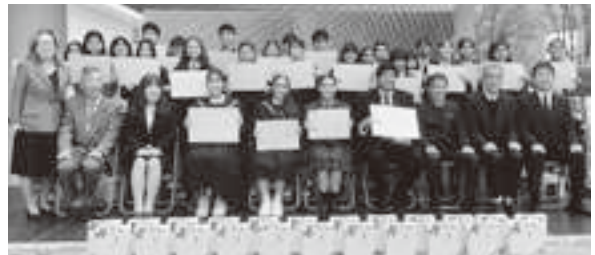
※同コンテストの結果は8Pに掲載しています。

これまで、二か国で生活し、文化を知り、嬉しさも困ったことも体験してきました。それは、どんな国に行っても同じことだと思います。ですが、どちらも嫌いではありません。それは、困らないと成長できないと考えているからです。嫌いだからという理由で諦めても、何も勉強にはなりません。困るからこそ、何とかしなきゃと思い、努力を重ねられると思います。それが、自分自身のレベルアップにつながると思い、生活しています。今では、私と同じ悩みを抱える人たちを救えるように、当時、私を前向きにさせてくれたように、心理に関わる仕事に就きたいと考えています。ブラジルでの自由さ、明るさ、日本での勉強や部活動など一生懸命楽しみながらがんばる姿を取り入れ、より良い人になれるように、努力し続けたいです。