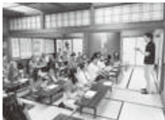
6/10 三の丸会館で茶道体験

(The Greater Toledo International Youth Orchestra) が13年ぶり2度目の来豊