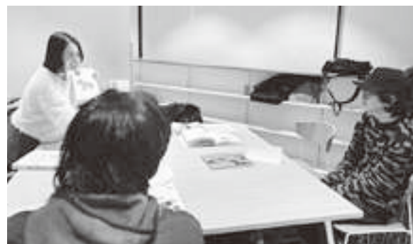
日本語ボランティア活動の様子

この約3年間の「にほんごきょうしつ」での経験は、私にとってかけがえのない宝物です。学習者の皆さんから教わったこと、活動を通じて得られた多くの気づき、そして支えてくださった方々への感謝の気持ちを胸に、これからも自分を磨き続けていきたいと思っています。