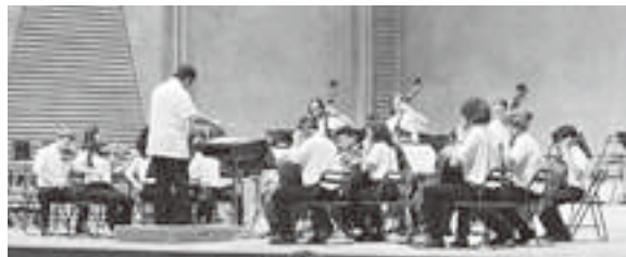
6/12 ライフポートとよはしコンサートホールでの演奏会

本協会の設立35周年記念事業の一環として、豊橋市の姉妹都市であるアメリカ・オハイオ州トリード市から、グレーター・トリード・インターナショナル・ユース・オーケストラ(GTiYO)が2011年以来、13年ぶりに2度目の来豊をしました。