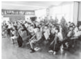
6/11 羽田中学校で部活動交流