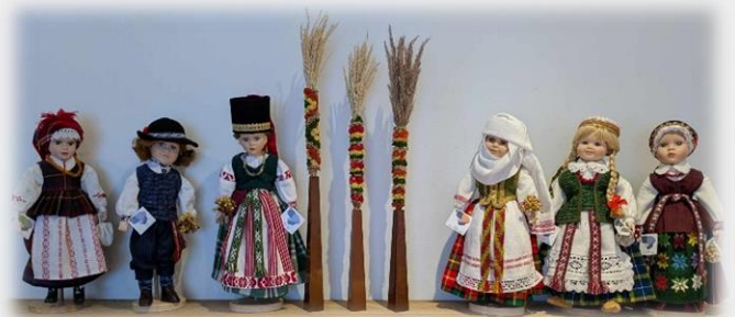
リトアニアの民族衣装を着た人形