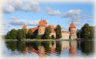
湖上に浮かぶトゥラカイ城

「森と湖の国」として知られるリトアニア。ヨーロッパの北部に位置し、バルト海に面しています。