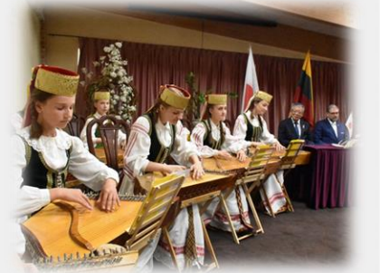
パートナーシティ協定締結式